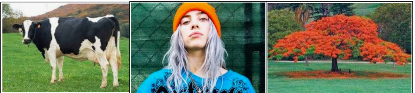
Alto grado de realismo: fotografía en color

TÉCNICA: La técnica es libre, puedes hacerlo con el material que quieras y utilizar cualquier manera para expresarte, acuérdate que en el tema anterior hemos aprendido a expresarnos con el punto, la línea, el plano, las texturas, el color... aplica esos conocimientos para realizar esta tarea.