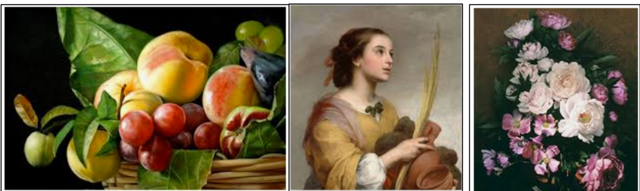
Alto grado realismo: pintura realista

Para realizar esta actividad debes ELEGIR UNA Y SOLO UNA DE LAS SEIS IMÁGENES realistas anteriores, verás que hay imágenes realistas de fotografía e imágenes realistas de pintura.